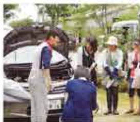
会員工場は「くるまのお医者さん」。愛車の健康診断は私たちにお任せください!

クルマの部品は、気付かないうちに摩耗・劣化しています。そうした状態で使用し続けると、重度の故障による多額の出費、さらには交通事故といったリスクを背負うことになります。さまざまなリスクを回避する有効な手段として、日頃から点検・整備を心がけましょう。